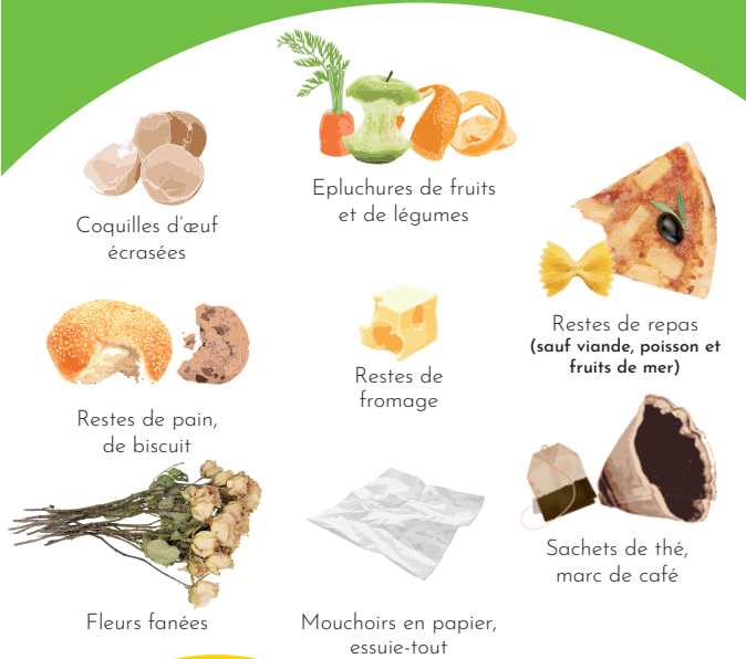
Coquilles d'œuf écrasées